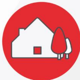
Habitation et loisirs