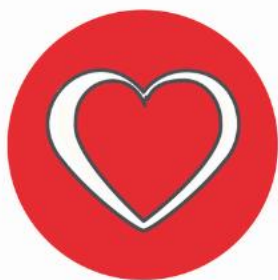
Santé et prévoyance